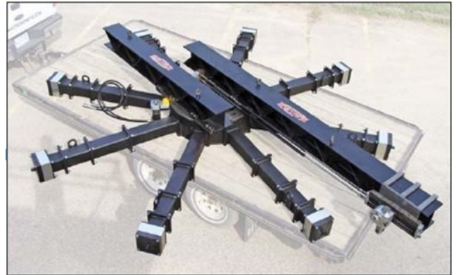
Máquina de refrentado de grandes diámetros DFM500

La máquina de refrentar Mactech LDFM 5000 se ha diseñado con capacidades para rectificado in situ de precisión, un solo punto, biselado y rectificado rotatorio en bridas de gran diámetro. Patas de montaje ajustables aseguran la máquina al diámetro interior de la pieza de trabajo. Entre sus características figuran avance mecánico desde varias rampas y velocidad variable en planos radiales y axiales. Opcionalmente, hay disponibles portaherramientas, cabezales de fresado y motores.