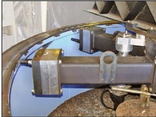
Patas de montaje ajustables

Refrentado y rectificado in situ de grandes diámetros